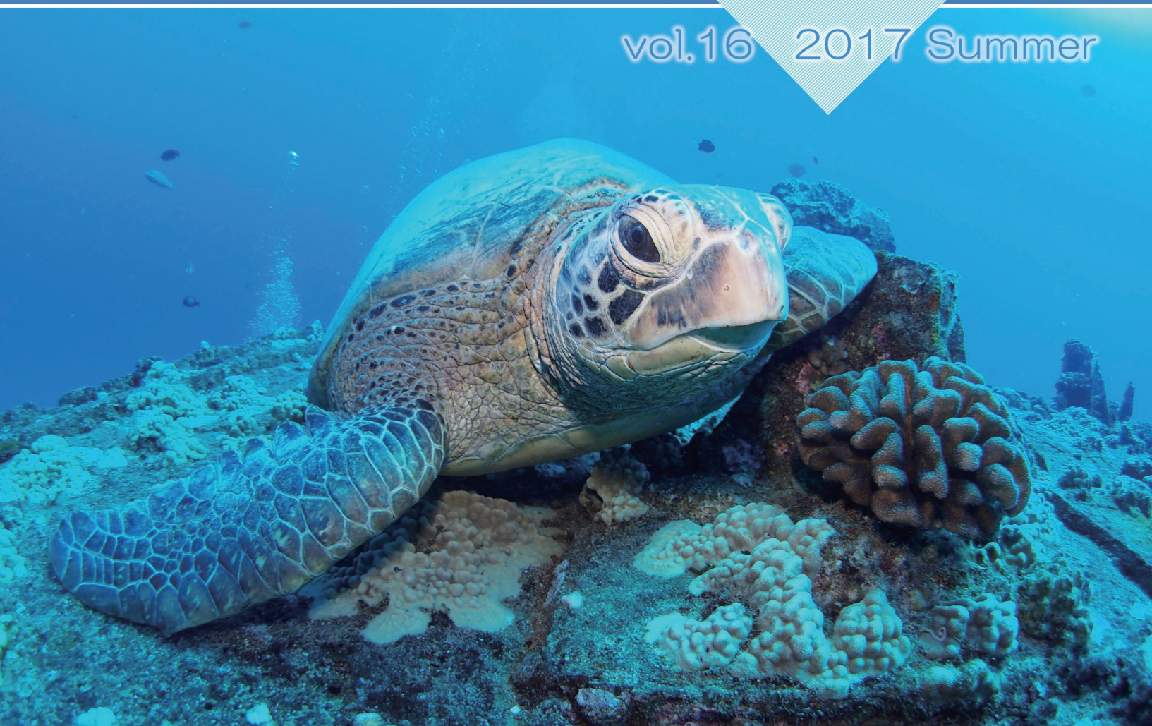
ウミガメ